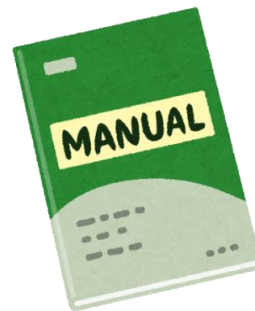
(図解)簡易マニュアル

注1) 当研修会参加には、Coubicアカウントの作成またはFacebookアカウントでのログインが必要です。