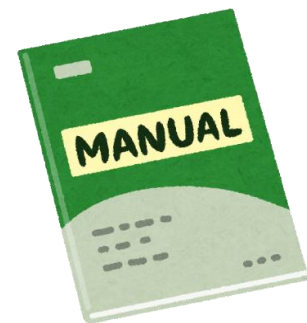
(図解)簡易マニュアル

注1) 当研修会参加には、Coubicアカウントの作成またはFacebookアカウントでのログインが必要です。